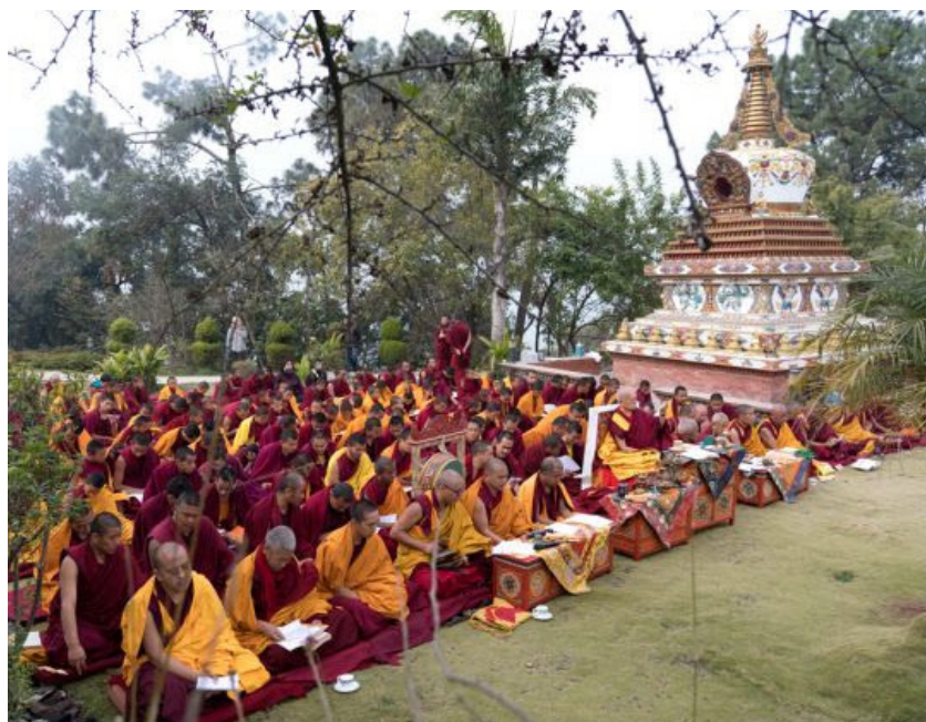
Lama Zopa Rimpoché y monjes haciendo una puja de incienso en el Monasterio de Kopan, febrero 2019.