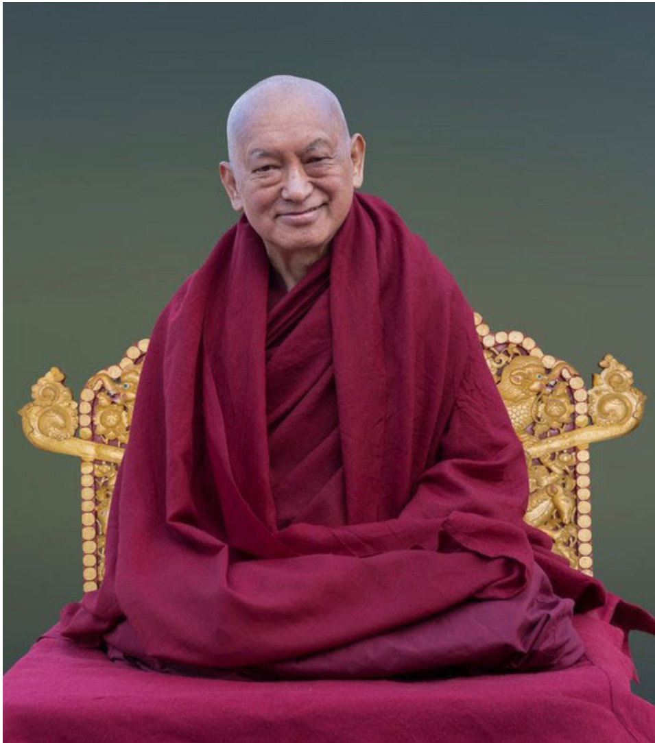
Lama Zopa Rinpoché, Nepal, Diciembre 2018.