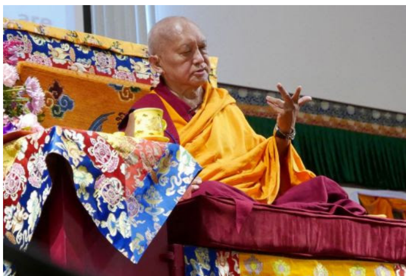
Lama Zopa Rimpoché enseñando en el retiro de la Luz del Camino 2016, Black Mountain, Carolina del Norte, Estados Unidos, Agosto 2016.

En Agosto 2016, durante el retiro de la Luz del Camino , Lama Zopa Rimpoché dio un consejo a un estudiante sobre cómo comprobar cuidadosamente cuando meditase en vacuidad: “cuando mucha gente medita en vacuidad dice que no existe nada. ¿Entiendes? Nada existe. Cuando haces esto, no estas meditando en vacuidad” Léelo completamente aquí o mira este vídeo .